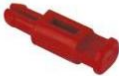
Perno di codifica CR CDS