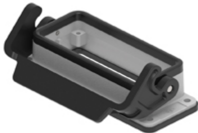
Anbaugehäuse, Gr.57.27, JEl Alu, 1 Bügel