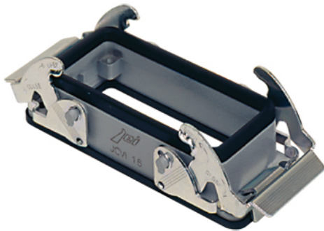
Anbaugehäuse, Gr.104.27, JEI Alu, 2 Bügel