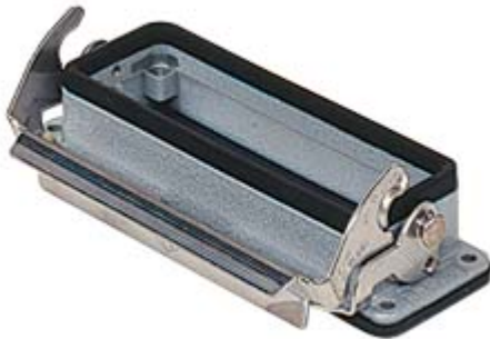
Anbaugehäuse, Gr.104.27, V-TYPE Alu, 1 Bügel