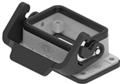
Anbaugehäuse, Gr.44.27, Alu, 1 Bügel IL-BRID