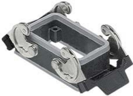
Anbaugehäuse, Gr.57.27, E-Xtreme Alu, 2 Bügel